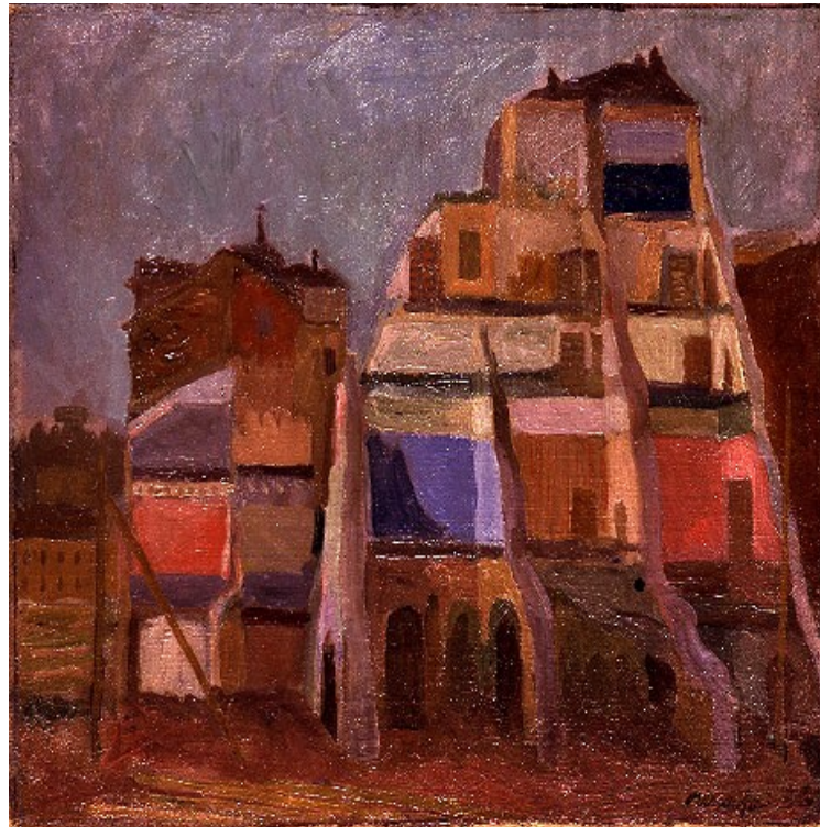
1. M. Mafai, Demolizioni di Via Giulia , 1936

Défaite par la guerre, la vision urbaine fasciste et autarcique, para-archéologique et totalitaire, se fait enfin submerger par d'autres conflits, d'autres espoirs, d'autres mythes.