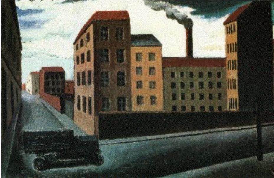
2. M. Sironi, Paesaggio urbano con camion , 1920